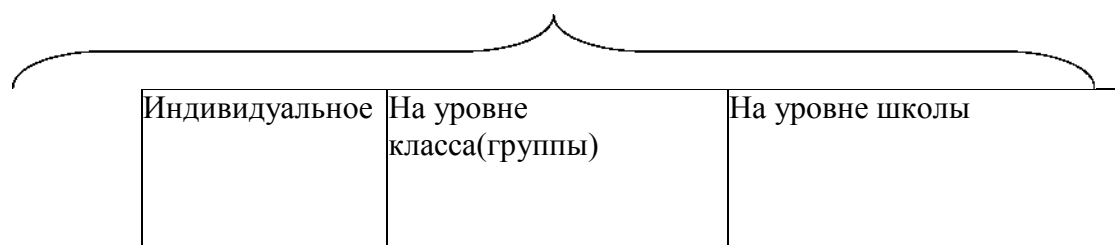
Основные формы сопровождения

Уровни психолого-педагогического сопровождения